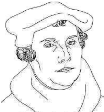
Dr. Martin Lutero