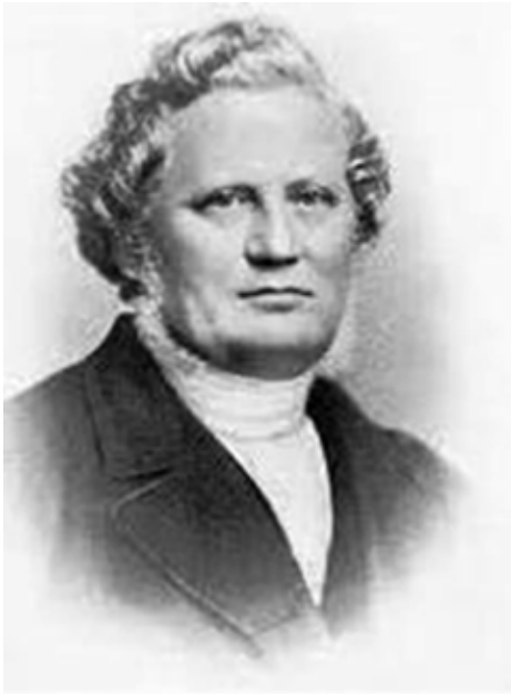
CARL OLOF ROSENIUS