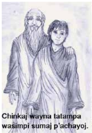
Chinkaj wayna talampa wasimpi sumaj p'achayoj.

p'achawan p'achallichisqa rikhurin. Anillotapis jap'illantaj; chayqa kashan Espíritu Santowan sellasqa kasqan, Diospa wawampuni kasqanrayku, manari uj "jornalerollachu". Umanchejpi sut'i kanan tiyan: Diospa qhasilla k'acha yanapaynenqa noqanchejman qosqa kashan. Jesucristopi tukuy sonqo creesqanchejmantapacha. Jesusqa nin: "...noqaman jamojkunatarí manapuni qhesachasajchu" nispa (Juan 6:37).