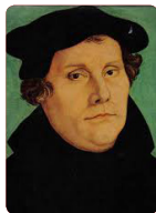
Martín Lutero Reformador