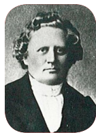
Carl Olof Rosenius